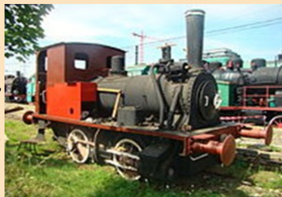
Lokomotywa z 1880 roku

Od wielu lat interesuję się kolejnictwem. Wszystkim zainteresowanym tym tematem polecam Muzeum Kolejnictwa w Warszawie. Muzeum mieści się przy ulicy Towarowej 3 i jest otwarte codziennie w godzinach 10:00 - 18.00. Warto zapamiętać, że w poniedziałki jest wstęp wolny.