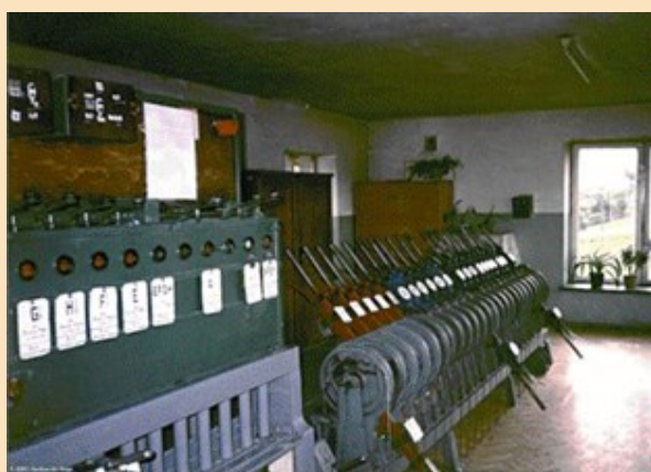
Stara nastawnia mechaniczna

W muzeum można obejrzeć zabytkowe lokomotywy i wagony oraz starą nastawnię mechaniczną. Jednym z najciekawszych eksponatów jest niemiecka lokomotywa z 1880 roku, którą prezentuję na zdjęciu poniżej. Została wyprodukowana w Hohenzollern w Düsseldorfie.