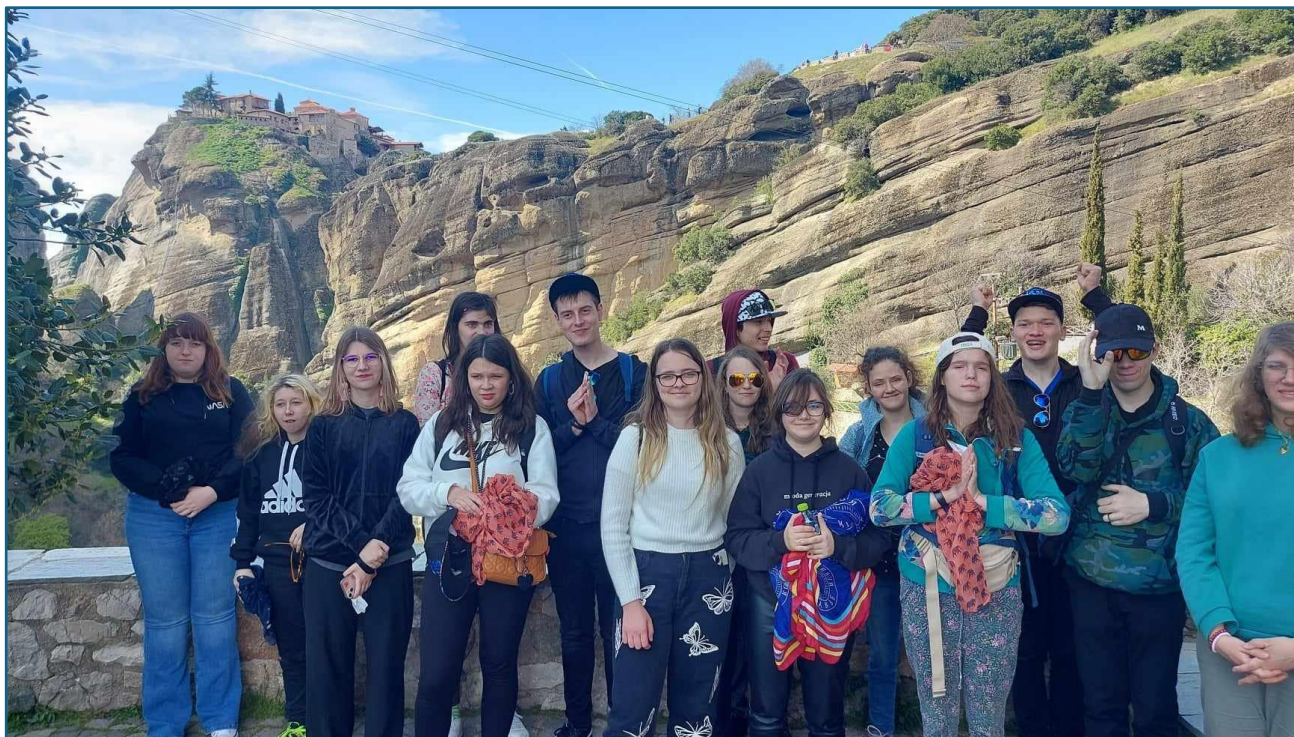
Kompleks klasztorny Meteory