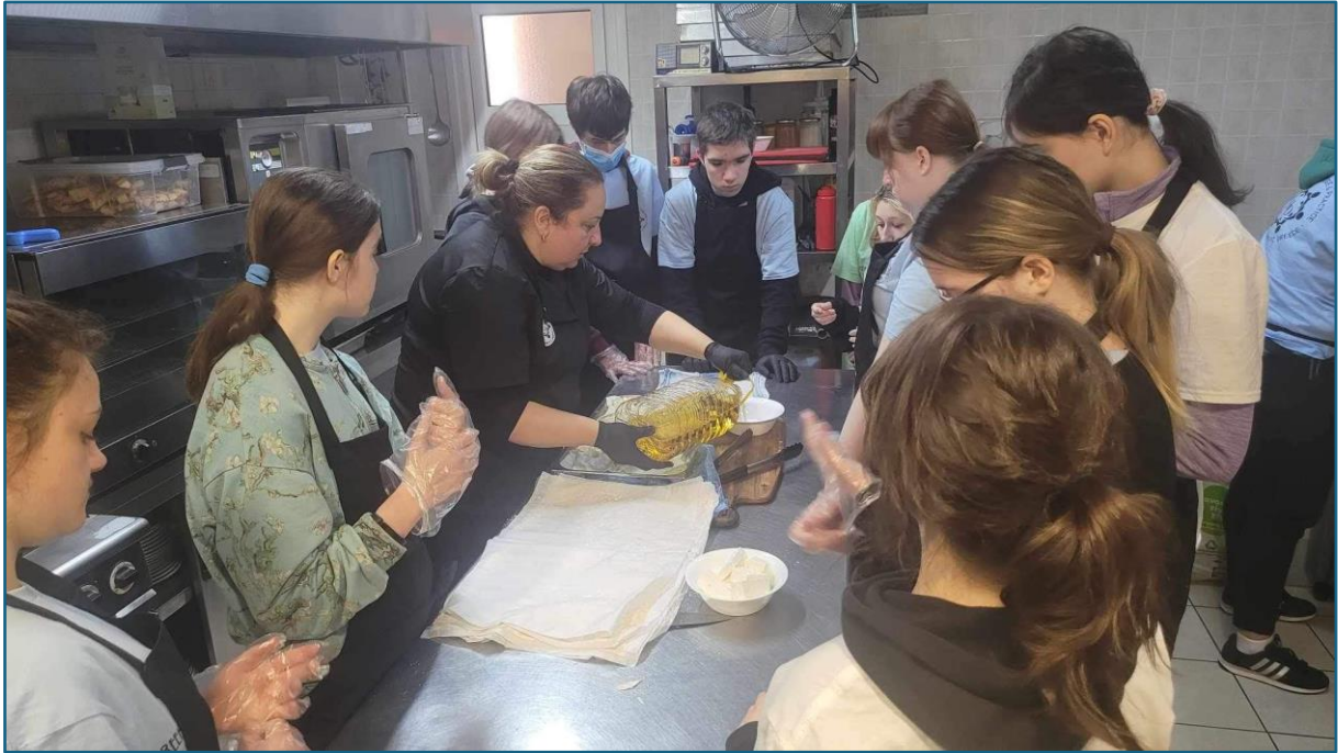
Przygotowanie greckich deserów, realizacja programu praktyk w zawodzie cukiernik