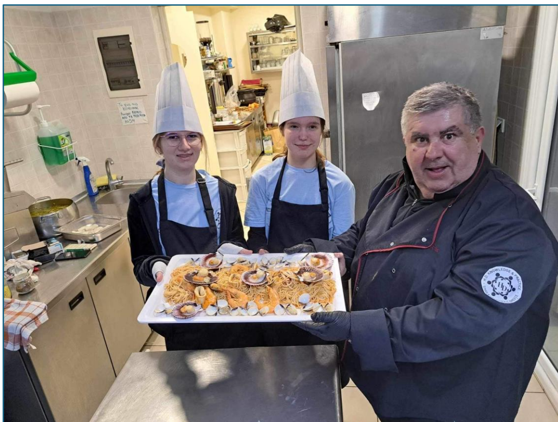
Przygotowanie dań z owocami morza , realizacja programu praktyk w zawodzie pracownik pomocniczy gastronomii

Uczestnicy prowadzili dzienniczki praktyk, w których każdego dnia zapisywali realizowane przez siebie działania.