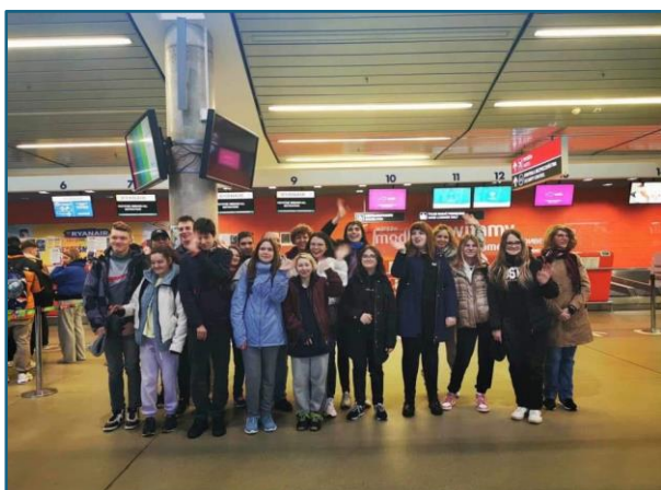
Uczestnicy wyjazdu na praktyki na lotnisku w Modlinie

Program praktyk został opracowany dla poszczególnych zawodów w porozumieniu z partnerem projektu Honoratą Domachowską. Przed wyjazdem uczestnicy projektu otrzymali odzież roboczą. Wykupiono ubezpieczenie podróży (polisa - OC, NNW, ubezpieczenie zdrowotne). Każdy z uczestników otrzymał 100 € kieszonkowego.