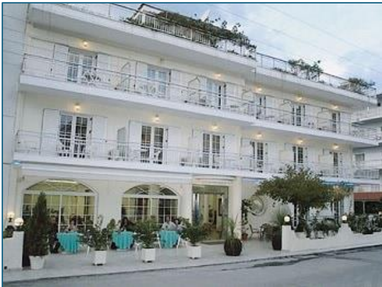
Hotel Posejdon, miejsce zakwaterowania i odbywania praktyk

Praktyki odbywały się w dniach 11 - 25.03.2024 r. w miejscowości Paralia Katerini w Grecji.