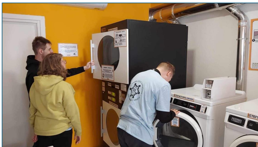
Usługi pralnicze, realizacja programu praktyk w zawodzie pracownik pomocniczy obsługi hotelowej