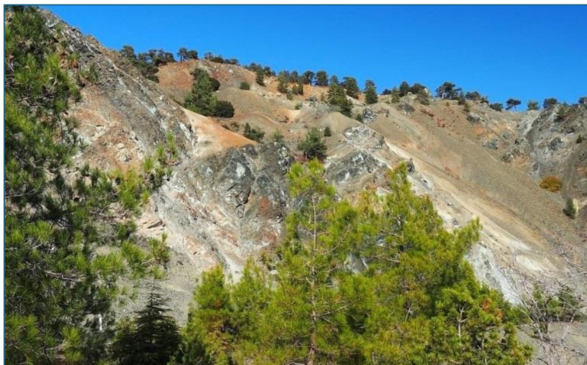
Widok na pasmo gór Olimp