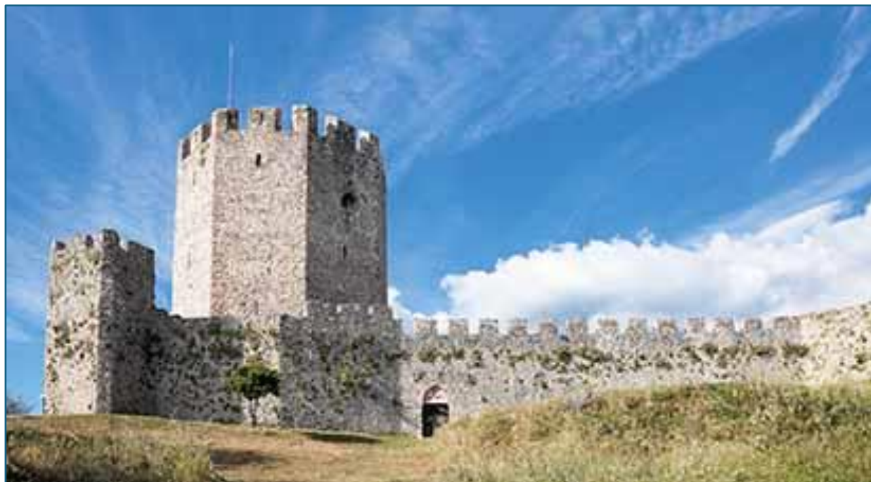
Ruiny zamku w Dion