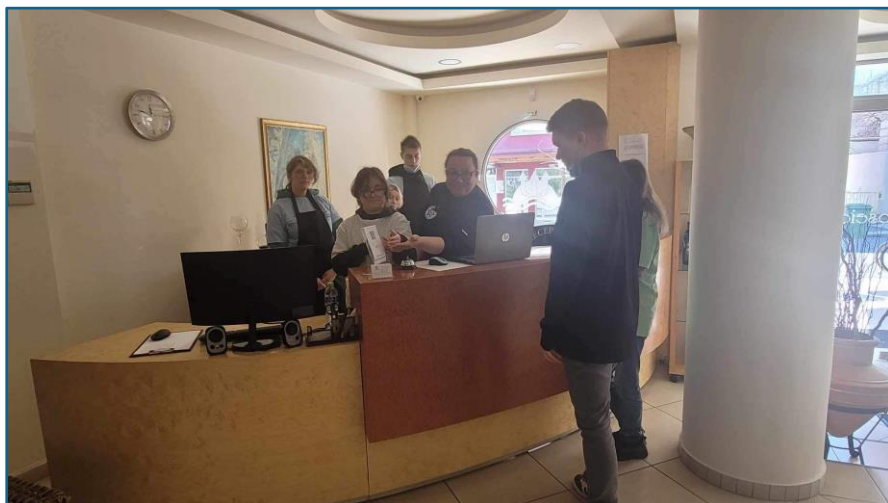
Zajęcia w recepcji hotelowej, realizacja programu praktyk w zawodzie pracownik pomocniczy obsługi hotelowej

W dni robocze realizowali program praktyk w hotelu Posejdon: w części produkcyjnej- cukiernik i pracownik pomocniczy gastronomii, w części pobytowej- pracownik pomocniczy obsługi hotelowej.