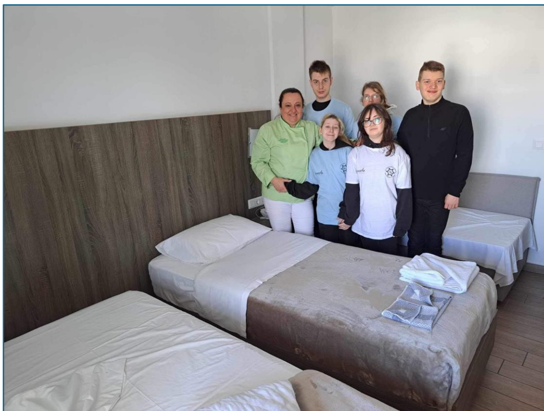
Przygotowanie jednostki mieszkalnej, realizacja programu praktyk w zawodzie pracownik pomocniczy obsługi hotelowej