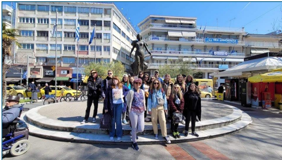
Pomnik w mieście Katerini